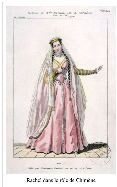
Rachel dans le rôle de Chimène

En 1637, Corneille fait jouer Le Cid . La pièce remporte un énorme succès. Richelieu protège Corneille, et le fait anoblir par le roi en 1637. Cependant, Jean Mairet et Georges de Scudéry, deux dramaturges, vont attaquer Corneille, en l'accusant de ne pas respecter les règles du théâtre classique, entre autres la règle des trois unités, règle préconisée en 1630 à la demande de Richelieu. Ils l'accusent également de poignarder dans le dos la France en guerre contre l'Espagne, en produisant une pièce dont le sujet, le titre, les personnages et les décors sont espagnols. En juin 1637, Scudéry fait appel à l'arbitrage de la toute jeune Académie française créée en 1635. Corneille, qui sait